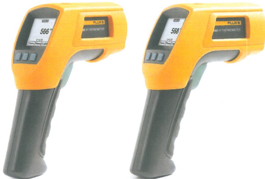
Рис.1 FLUKE моделей 566, 568.